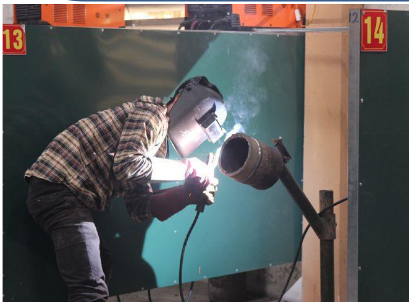
Học sinh học nghề hàn tại Trung tâm GDNN-GDTX huyện Diễn Châu (Nghệ An).