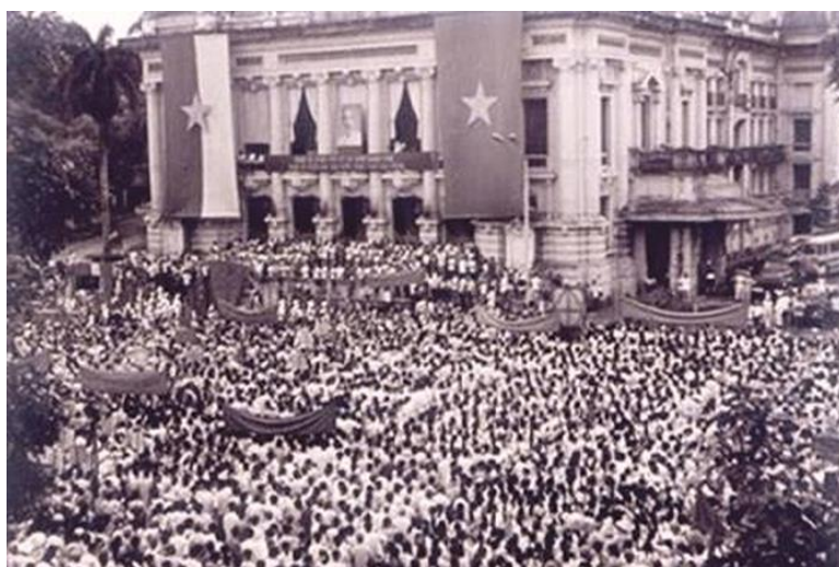
Mít tinh Tổng khởi nghĩa Tháng Tám năm 1945 tại Quảng trường Nhà hát Lớn (19/8/1945)

Thắng lợi của Cách mạng Tháng Tám là thắng lợi của ý chí độc lập tự chủ, tự lực, tự cường của dân tộc Việt Nam và là thắng lợi vĩ đại của tư tưởng Hồ Chí Minh về độc lập dân tộc gắn liền với chủ nghĩa xã hội ở Việt Nam. Từ thắng lợi to lớn đó, đã cổ vũ nhân dân ta kiên cường đấu tranh giành độc lập dân tộc, thống nhất đất nước, bằng Chiến dịch Hồ Chí Minh năm 1975 lịch sử. Đất nước hoàn toàn độc lập, người dân được hoàn toàn tự do, hạnh phúc.