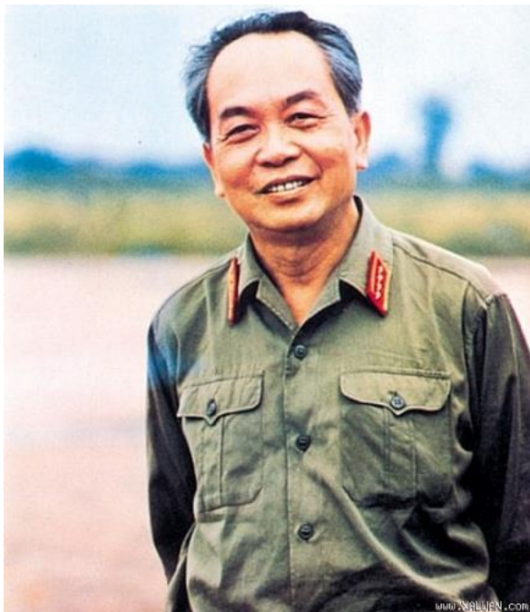
Đại tướng Võ Nguyên Giáp – Người anh hùng dân tộc, vị tướng của lòng dân

Võ Nguyên Giáp – Vị đại tướng trong lịch sử nhân loại không được đào tạo qua bất kỳ trường lớp quân sự nào, ông là một trong những thiên tài quân sự vĩ đại nhất mọi thời đại. Ngoài cương vị là một nhà quân sự đại tài, ông còn là một nhà chính trị, nhà ngoại giao xuất sắc. Và trên hết ở ông đó là một nhân cách lớn, một tấm lòng trong sạch luôn vì nước, vì dân.